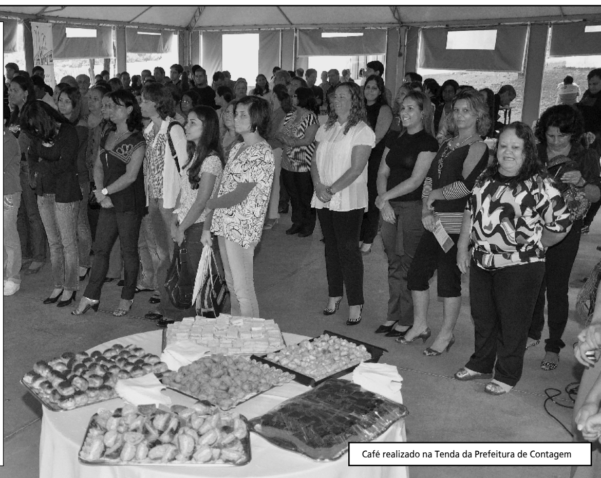
Café realizado na Tenda da Prefeitura de Contagem

O café da manhã foi um oferecimento do Banco Real, em parceria com a Prefeitura. O mês de outubro reservou uma série de atividades para o servidor municipal. A programação contou com aulas de ginástica laboral e dança, avaliação do estado de saúde com a aferição da pressão arterial e taxa de glicose, dicas de alimentação saudável e agricultura urbana, espaço de beleza, feira de artesanato feita pelas servidoras, inauguração do portal e, por fim, a Festa do Servidor, realizada na última sexta (30), encerrando as comemorações.